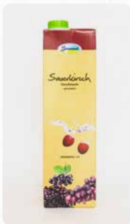
Sauerkirsch Art.-Nr. 14414