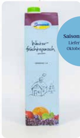
Winterfrüchtepunsch Art.-Nr. 14413

Saisonprodukt Lieferbar von Oktober – März.