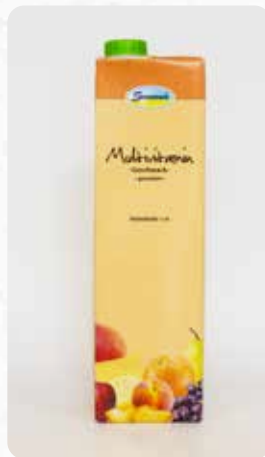
Multivitamin Art.-Nr. 14412