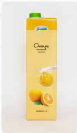
Orange Art.-Nr. 14410