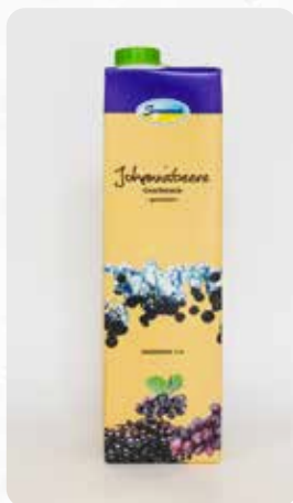
Schwarze Johannisbeere Art.-Nr. 14415