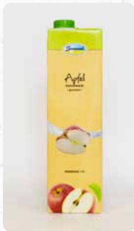
Apfel Art.-Nr. 14411