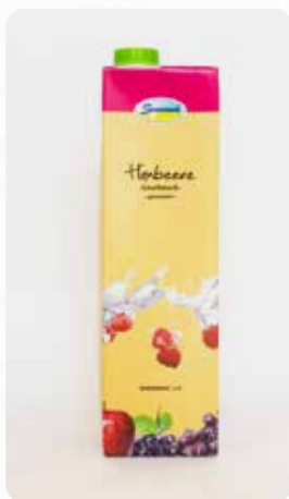
Himbeere Art.-Nr. 14417