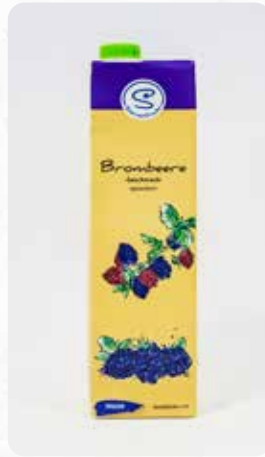
Brombeere Art.-Nr. 14416